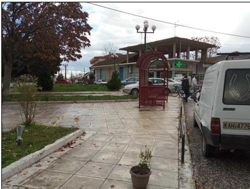
Φωτογραφία 35: Στάση ΜΜΜ πλησίον Ι.Ν. Αγίου Αθανασίου

Με το παρόν Σχέδιο Αστικής Προσβασιμότητας για το Προάστιο επιχειρείται αρχικά η σύνδεση των κοινοχρήστων και κοινωφελών χώρων του οικισμού και η ενίσχυση της ασφάλειας στις μετακινήσεις πεζών και αμαξιδίων. Για την επίτευξη αυτών των στόχων έμφαση δίνεται αρχικά στην κατασκευή νέων πεζοδρομίων. Πιο συγκεκριμένα, προτείνεται: