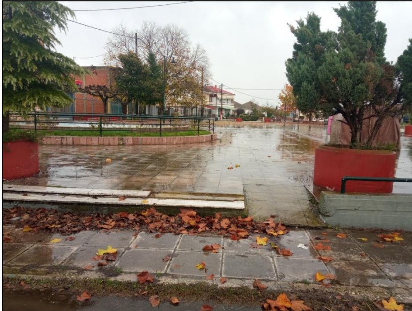
Φωτογραφία 30: Πλατεία Πεδινού / Ανακατασκευή ράμπας πρόσβασης