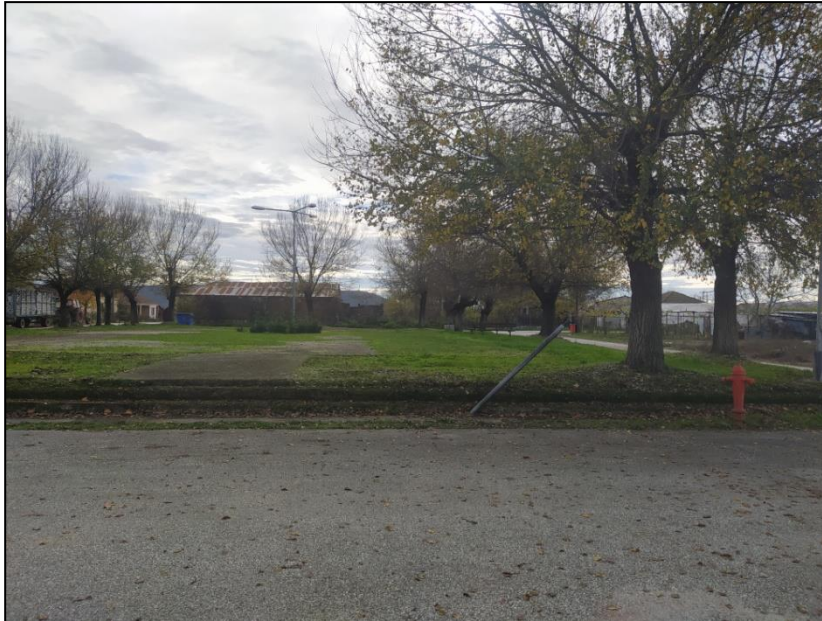
Φωτογραφία 37: Πλατεία Ηλιά

Εξαιτίας του μικρού μεγέθους του οικισμού, οι προτεινόμενες παρεμβάσεις για τον Ηλιά περιορίζονται στην κατασκευή ενός περιμετρικού πεζοδρομίου στην πλατεία, ελάχιστου πλάτους 1,5μ. και με δυο ράμπες πρόσβασης ΑμεΑ (βόρεια και νότια), στην κατασκευή πεζοδρομίου (πλάτους 1,5μ.) και στη δημιουργία μιας θέσης στάθμευσης ΑμεΑ νότια του Ι.Ν. Προφήτη Ηλία.