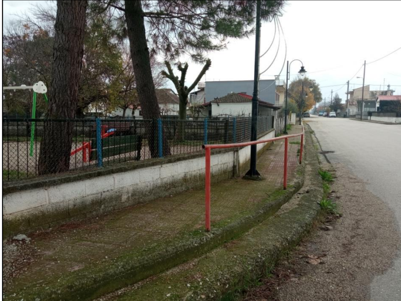
Φωτογραφία 25: Παιδική χαρά & πεζοδρόμιο έμπροσθεν αυτής

πολλά εμπόδια από δένδρα, κάγκελα και ιστούς φωτισμού, οξύνουν το πρόβλημα της προσβασιμότητας. Τέλος, στο βόρειο τμήμα του οικισμού καταγράφεται το δημοτικό σχολείο (δεν λειτουργεί σήμερα) και δύο αθλητικοί χώροι.