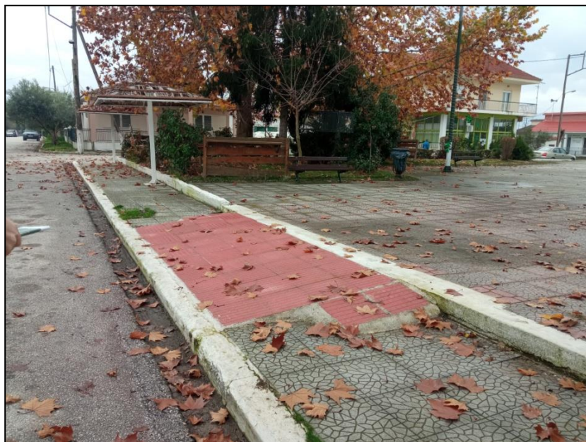
Φωτογραφία 23: Πλατεία Καλογριανών & υπάρχουσα ράμπα πρόσβασης ΑμεΑ