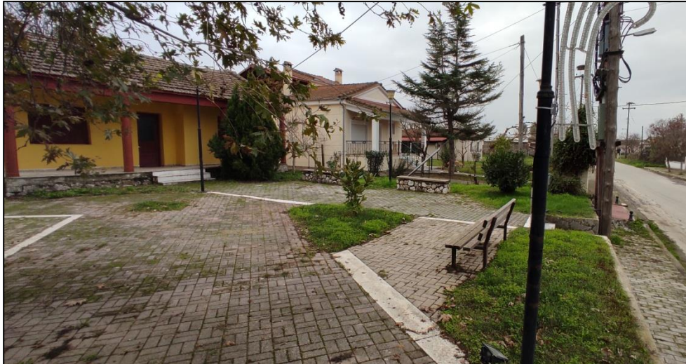
Φωτογραφία 11: Πλατεία & κοινοτικό γραφείο στα Καλυβάκια

Ως προς τις κοινόχρηστες και κοινωφελείς χρήσεις στον οικισμό καταγράφεται μια πλατεία επί της οποίας εντοπίζεται το κτίριο του κοινοτικού γραφείου. Η πρόσβαση στην πλατεία γίνεται μέσω κλίμακας 5 σκαλοπατιών, ενώ για την προσβασιμότητα των ΑμεΑ έχει διαμορφωθεί ράμπα πρόσβασης στο βόρειο τμήμα της, η κλίση της οποίας είναι απαγορευτική. Επιπρόσθετα, καταγράφονται ένας χώρος πρασίνου (νότια), το γραφείο του πολιτιστικού συλλόγου και η σχολή εικαστικών τεχνών (λειτουργεί 3 φορές την εβδομάδα), ο Ι.Ν. Αγίου Αθανασίου, μια παιδική χαρά και το κτίριο του τεχνικού λυκείου όπου λειτουργούν ορισμένα εργαστήρια. Επισημαίνεται εδώ ότι τα κτίρια των κοινωφελών χρήσεων δεν είναι προσβάσιμα στα ΑμεΑ, ενώ για την πρόσβαση στην εκκλησία έχουν διαμορφωθεί σκαλοπάτια με κάγκελα επί του υπάρχοντος πεζοδρομίου (ανατολικά), τα οποία αποτελούν εμπόδιο στην μετακίνηση πεζών και αμαξιδίων.