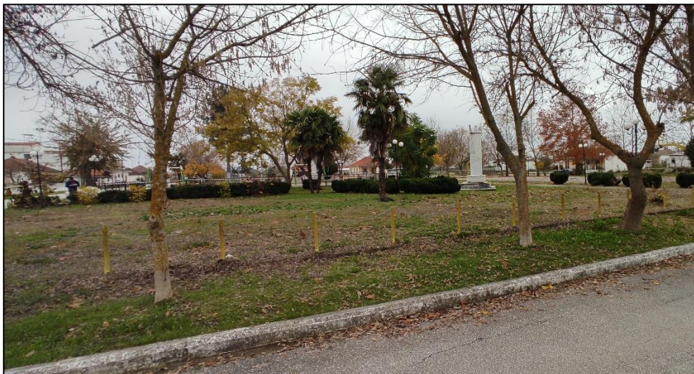
Φωτογραφία 19: Χώρος πρασίνου

Ως προς τις υποδομές για τις μετακινήσεις πεζών, αυτές είναι ελάχιστες. Πεζοδρόμια έχουν κατασκευαστεί στο νότιο και ανατολικό τμήμα της εκκλησίας καθώς και στο νότιο και ανατολικό τμήμα της πλατείας, χωρίς όμως να είναι προσβάσιμα στα ΑμεΑ.