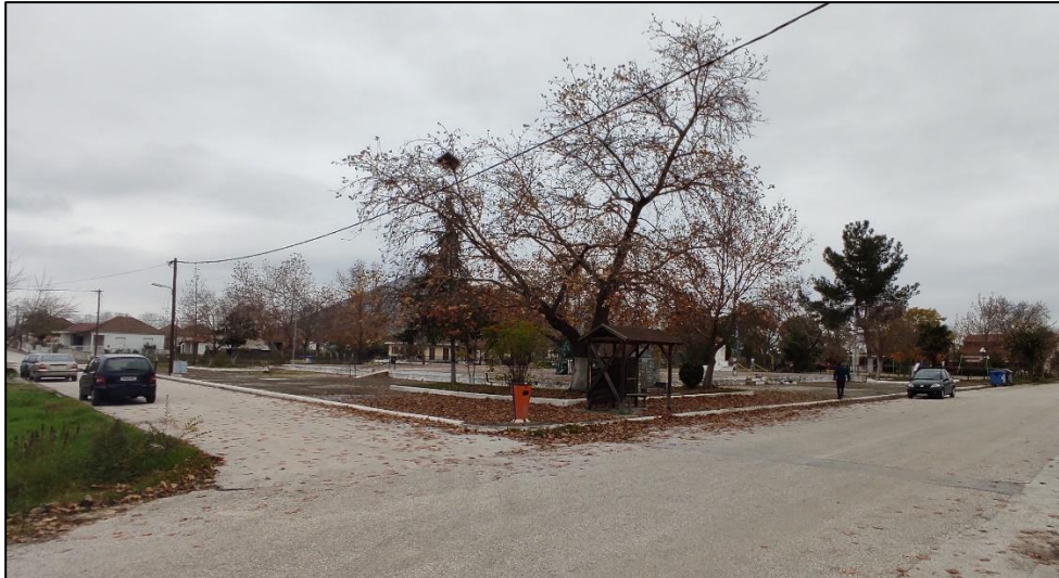
Φωτογραφία 20: Πλατεία Μεταμόρφωσης

Αξιοσημείωτο στην ευρύτερη περιοχή είναι ο Ι.Ν. Μεταμόρφωσης του Σωτήρων, μια γραφική εκκλησία, χωροθετημένη σε λόφο, με διαμορφωμένο περιβάλλον χώρο, όπου πραγματοποιούνται εκδηλώσεις τον Αύγουστο.