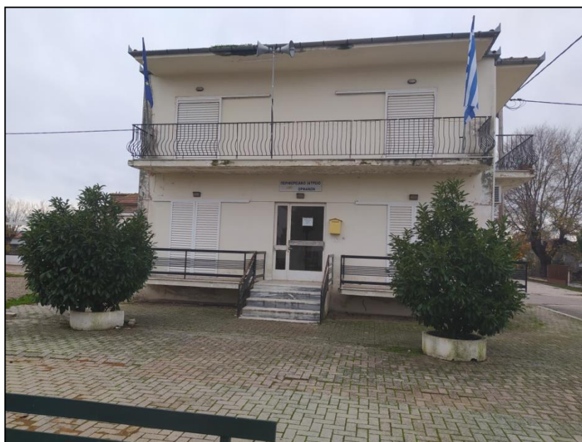
Φωτογραφία 45: Κοινοτικό γραφείο / αγροτικό ιατρείο