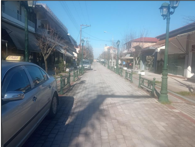
Φωτογραφία 2: Δρόμος ήπιας κυκλοφορίας & πεζόδρομος

Πέραν των παραπάνω παρεμβάσεων, σε όλο τον υπόλοιπο αστικό ιστό τα πεζοδρόμια είναι είτε με απλή τσιμεντόστρωση, είτε παρατηρείται μόνο το κράσπεδο - ρείθρο χωρίς διαμόρφωση, είτε απουσιάζουν πλήρως.