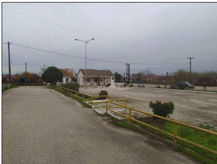
Φωτογραφία 42: Πλατεία Λεύκης

Πιο αναλυτικά, η πλατεία βρίσκεται λίγο πιο χαμηλά από το επίπεδο του δρόμου, αποτελείται από ισόπεδη επιφάνεια με αστικό εξοπλισμό και φυτεύσεις, περικλείεται από κάγκελα, ενώ για την πρόσβαση σε αυτή υπάρχουν τρία ανοίγματα από το επίπεδο του δρόμου. Επιπρόσθετα, το κτίριο του κοινοτικού γραφείου είναι εύκολα προσβάσιμο από το δρόμο αλλά υπάρχει ένα σκαλοπάτι στην είσοδο του κτιρίου. Για την πρόσβαση των ΑμεΑ στον Ι.Ν. Αγίου Γεωργίου δεν υπάρχει ράμπα, ούτε στο πεζοδρόμιο έμπροσθεν, ούτε στο κτίριο της εκκλησίας. Για το χώρο πρασίνου και το γήπεδο μπάσκετ δεν έχουν κατασκευαστεί υποδομές για την προσβασιμότητα των ΑμεΑ, ενώ η πρόσβαση στην παιδική χαρά γίνεται από το υπάρχον πεζοδρόμιο στη νότια πλευρά της.