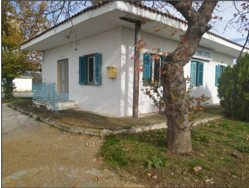
Φωτογραφία 36: Κοινοτικό γραφείο

οικισμό είναι αξιοσημείωτη η ανυπαρξία πεζοδρομίων. Επιπρόσθετα, ανύπαρκτες είναι και οι υποδομές για την προσβασιμότητα των ΑμεΑ.