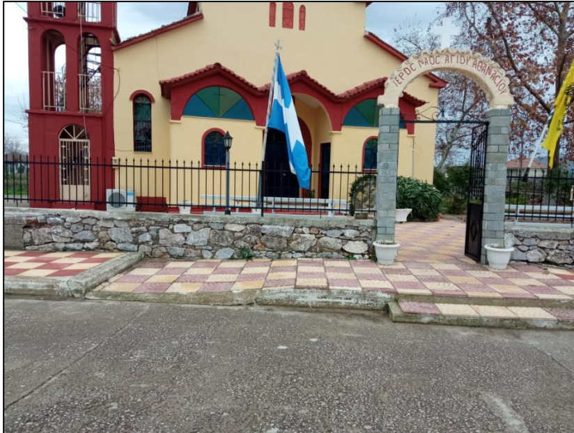
Φωτογραφία 27: Ι.Ν. Αγίου Αθανασίου / Ανακατασκευή ράμπας πρόσβασης

Συμπερασματικά, οι προτεινόμενες παρεμβάσεις για τον οικισμό εστιάζονται στην κατασκευή περιμετρικού πεζοδρομίου ελάχιστου πλάτους 1,5 μ. και 3 ραμπών πρόσβασης ΑμεΑ στην πλατεία, στην ανακατασκευή της ράμπας πρόσβασης στον Ι.Ν., στη δημιουργία μιας θέσης στάθμευσης ΑμεΑ στο ανατολικό τμήμα της πλατείας, καθώς και στη μετατόπιση της στάσης ΜΜΜ σε καταλληλότερη θέση. Τέλος, προτείνεται η αλλαγή της πόρτας εισόδου της παιδικής χαράς και η τοποθέτησή της στη βόρεια πλευρά.