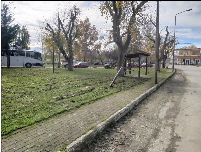
Φωτογραφία 40: Χώρος πρασίνου και στάση ΜΜΜ

Τέλος, ως προς τις υποδομές για την ασφαλή μετακίνηση πεζών σημειώνεται ότι στον οικισμό της Ιτέας έχουν κατασκευαστεί πεζοδρόμια, κυμαινόμενου πλάτους 1,0μ. έως 1,7μ., τα οποία αποτελούνται από τσιμέντο μόνο κατά μήκος των δυο βασικών δρόμων που συνδέουν την Ιτέα με τον Παλαμά. Τα πεζοδρόμια αυτά δεν είναι προσβάσιμα στα ΑμεΑ. Επιπρόσθετα, μόνο για το τμήμα του κέντρου, δηλαδή από την πλατεία μέχρι τους χώρους πρασίνου (νότια) στην περιοχή της γέφυρας, υπάρχουν πεζοδρόμια διαμορφωμένα με πλακοστρώσεις, χωρίς οδεύσεις τυφλών και ράμπες πρόσβασης ΑμεΑ. Σε αυτό το τμήμα του οδικού δικτύου υπάρχουν επιπλέον διαμορφωμένες νησίδες πρασίνου, πλάτους <3,0 μ. Στον υπόλοιπο οικισμό καταγράφεται απουσία πεζοδρομίων.