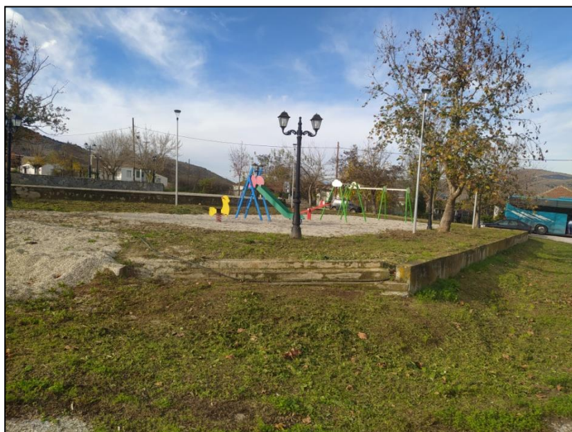
Φωτογραφία 5: Παιδική χαρά Αγίου Δημητρίου

Για τον οικισμό του Αγίου Δημητρίου οι προτεινόμενες παρεμβάσεις περιλαμβάνουν την κατασκευή περιμετρικού πεζοδρομίου στο οικοδομικό τετράγωνο που βρίσκεται η πλατεία και η παιδική χαρά με ράμπες πρόσβασης ΑμεΑ σε όλα τα επίπεδα (3 ράμπες συνολικά). Επιπρόσθετα, προτείνεται η κατασκευή πεζοδρομίου νότια και δυτικά του κτιρίου του