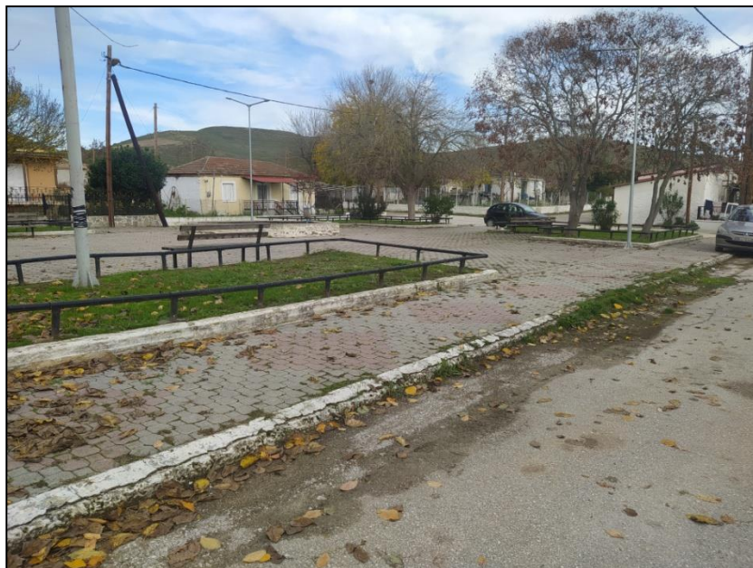
Φωτογραφία 47: Πλατεία Συκεώνας

καταγράφεται η πλατεία και στη συνέχειά της (ανατολικά) η παιδική χαρά. Η πλατεία είναι μια ισόπεδη επιφάνεια, με αστικό εξοπλισμό και φυτεύσεις, χωρίς όμως ράμπες πρόσβασης για τα ΑμεΑ. Στο νότιο τμήμα του οικισμού εντοπίζονται το κοινοτικό γραφείο και το αγροτικό ιατρείο. Σημειώνεται ότι τα κτίρια αυτά δεν είναι προσβάσιμα στα ΑμεΑ. Τέλος, στο νοτιο-δυτικό τμήμα του οικισμού καταγράφονται δυο αθλητικοί χώροι (γήπεδο ποδοσφαίρου και γήπεδο μπάσκετ) και ένας χώρος πρασίνου, βορειο-δυτικά χωροθετείται ο Ι.Ν. Γένεσης Θεοτόκου, ενώ διάσπαρτα στον οικισμό εντοπίζονται 3 στάσεις ΜΜΜ (κιόσκια).