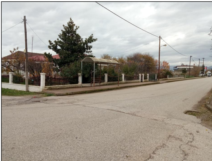
Φωτογραφία 29: Πεζοδρόμιο κεντρικού δρόμου & στάση ΜΜΜ