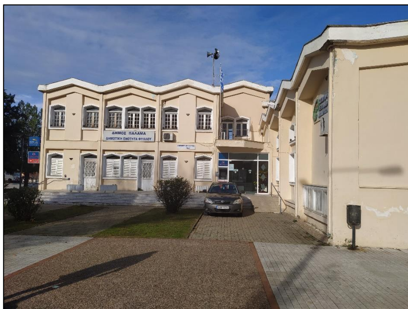
Φωτογραφία 39: Παλιό Δημαρχείο, ΚΕΠ, ΕΛΤΑ

Επιπρόσθετα στις χρήσεις γης, στο νότιο τμήμα του οικισμού καταγράφονται τα σχολεία (νηπιαγωγείο, δημοτικό, γυμνάσιο και λύκειο), αξιόλογοι χώροι πρασίνου, ο Ι.Ν. Αρχαγγέλων Μιχαήλ & Γαβριήλ, αθλητικοί χώροι (γήπεδα ποδοσφαίρου, μπάσκετ, τέννις) και το Αγροτικό - Λαογραφικό Μουσείο Ιτέας.