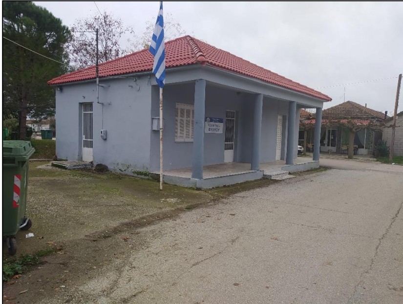
Φωτογραφία 51: Κοινοτικό γραφείο / αγροτικό ιατρείο

μέχρι την πλατεία και περιμετρικά αυτής υπάρχει διαμορφωμένο πεζοδρόμιο, μέσου πλάτους 2,0μ., με πλακόστρωση από τη μια πλευρά της οδού, χωρίς όμως ράμπες ΑμεΑ και οδεύσεις τυφλών. Από την κεντρική πλατεία μέχρι την έξοδο του οικισμού προς Ορφανά υπάρχει πεζοδρόμιο αποτελούμενο από τσιμέντο στη μια πλευρά της οδού και με απουσία ραμπών πρόσβασης για τα ΑμεΑ. Τέλος, στο νότιο άκρο της πλατείας υπάρχει στάση ΜΜΜ (κίοσκι), επί του υπάρχοντος πεζοδρομίου, χωρίς να αποτελεί εμπόδιο.