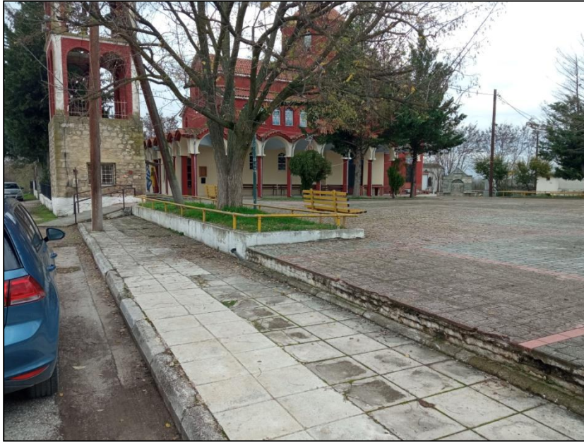
Φωτογραφία 28: Ι.Ν. Αγίου Νικολάου & Πλατεία / Ανακατασκευή ράμπας πρόσβασης

είναι προσβάσιμο στα ΑμεΑ. Επιπρόσθετα σε αυτές τις χρήσεις, στο κέντρο του οικισμού καταγράφεται το δημοτικό σχολείο (στο οποίο έχει κατασκευαστεί πρόσφατα ράμπα ΑμεΑ), μια παιδική χαρά με σύγχρονο εξοπλισμό και ένα μικρό πλάτωμα. Τέλος, σε δυο θέσεις κατά μήκος του κεντρικού δρόμου καταγράφονται στάσεις ΜΜΜ (κίосκια) χωροθετημένες επί του υπάρχοντος πεζοδρομίου. Επειδή τα κίосκια αυτά περιορίζουν αρκετά το πλάτος του πεζοδρομίου, κρίνεται αναγκαία η μετατόπισή τους σε άλλη καταλληλότερη θέση.