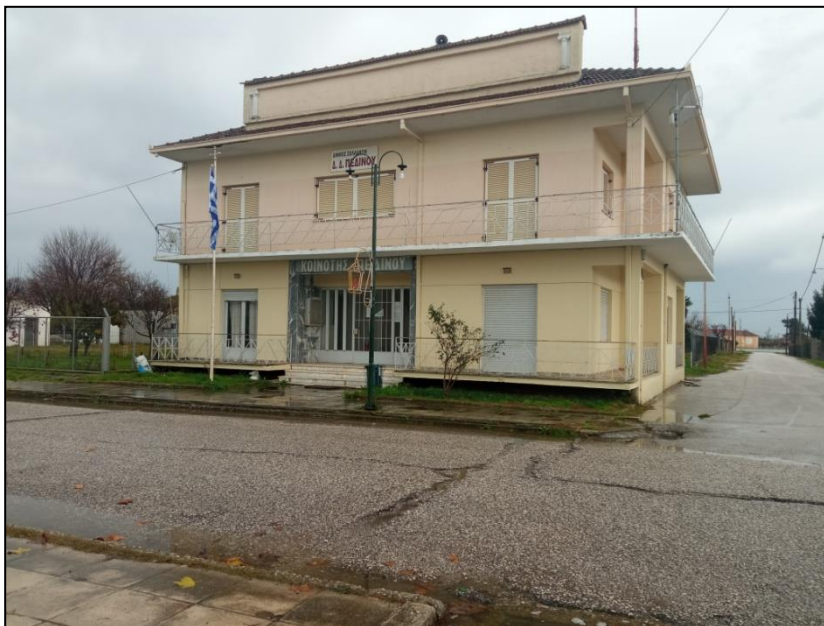
Φωτογραφία 31: Κοινοτικό γραφείο Πεδινού

Οι προτεινόμενες παρεμβάσεις για τον οικισμό του Πεδινού αφορούν αρχικά την κατασκευή ραμπών πρόσβασης ΑμεΑ στα πεζοδρόμια νότια της πλατείας και την ανακατασκευή της ράμπας πρόσβασης στην πλατεία. Επιπλέον, προτείνεται η κατασκευή μιας ράμπας εισόδου στο κτίριο του κοινοτικού γραφείου, μιας στο κτίριο του πνευματικού κέντρου, η δημιουργία μιας θέσης στάθμευσης ΑμεΑ ανατολικά της πλατείας και η μετατόπιση της στάσης ΜΜΜ (κίосκι) σε καταλληλότερη θέση.