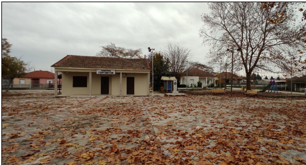
Φωτογραφία 9: Πλατεία Γοργοβιτών

Ο οικισμός Γοργοβίτες χωροθετείται νοτιοδυτικά στα διοικητικά όρια του Δήμου Παλαμά, στα όρια με τη ΔΕ Κάμπου του Δήμου Καρδίτσας. Πρόκειται για οικισμό ο οποίος αναπτύχθηκε εκατέρωθεν της παλιάς επαρχιακής οδού Γοργοβίτες - Παλαμάς. Η τυπολογία του ρυμοτομικού του οικισμού διακρίνεται από ορθογωνική διάταξη οικοδομικών τετραγώνων και κάθετους μεταξύ τους οδικούς άξονες. Στο κέντρο εντοπίζεται η πλατεία και καταστήματα εμπορίου και αναψυχής, μικρής εμβέλειας, για την εξυπηρέτηση των κατοίκων. Η πλατεία αποτελείται από ισόπεδη διαμορφωμένη επιφάνεια επί της οποίας χωροθετείται το κτίριο του κοινοτικού γραφείου όπου φιλοξενείται το αγροτικό ιατρείο και μια παιδική χαρά. Οι προαναφερόμενοι χώροι δεν είναι προσβάσιμοι στα ΑμεΑ, ενώ στο δυτικό άκρο της πλατείας έχει κατασκευαστεί ράμπα πρόσβασης ΑμεΑ, η κλίση της οποίας κρίνεται ακατάλληλη σύμφωνα με τις προδιαγραφές.