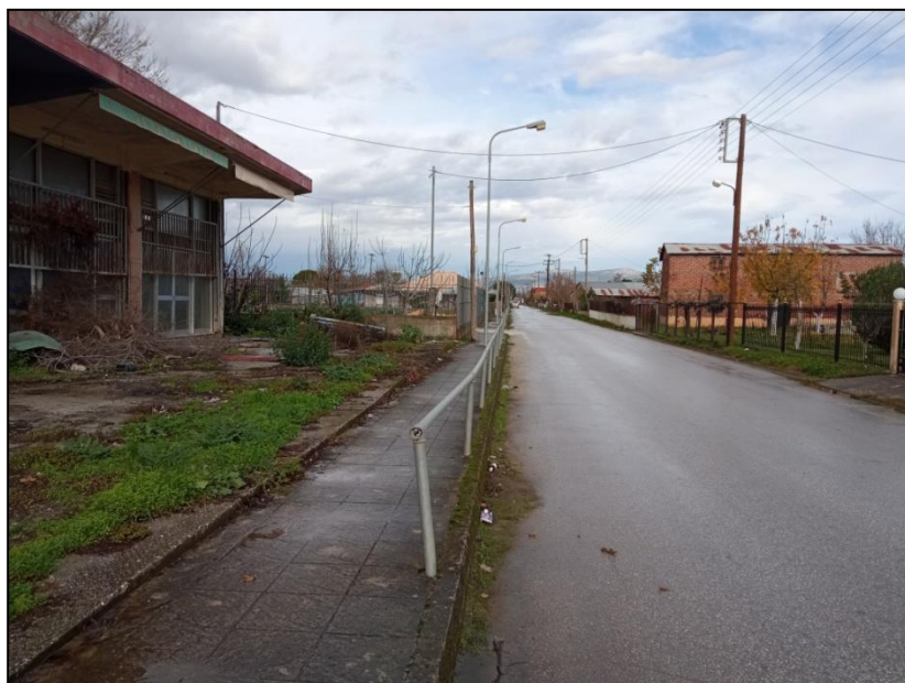
Φωτογραφία 32: Επαρχιακή οδός Προαστίου - Σερβωτών & πεζοδρόμιο

Στην πλειονότητά του ο οικισμός χαρακτηρίζεται από απουσία πεζοδρομίων. Εξαίρεση αποτελεί η οδός Παπάγου όπου υπάρχει διαμορφωμένο πλακόστρωτο πεζοδρόμιο, η οδός Ελευθερίας όπου υπάρχει πεζοδρόμιο αποτελούμενο από τσιμέντο, ένα μικρό τμήμα της επαρχιακής οδού στην περιοχή του Γυμνασίου όπου το πεζοδρόμιο είναι διαμορφωμένο πλακόστρωτο αλλά αρκετά στενό και με εμπόδια (ιστοί φωτισμού), μικρά τμήματα (στο κέντρο) των οδών Ελ. Βενιζέλου και Αγίου Νικολάου με διαμορφωμένα πεζοδρόμια τα οποία όμως έχουν καταληφθεί από προϊόντα των εμπορικών καταστημάτων και από την εστίαση. Σε όλα τα πεζοδρόμια απουσιάζουν οι υποδομές για την πρόσβαση των ΑμεΑ (οδεύσεις τυφλών και ράμπες).