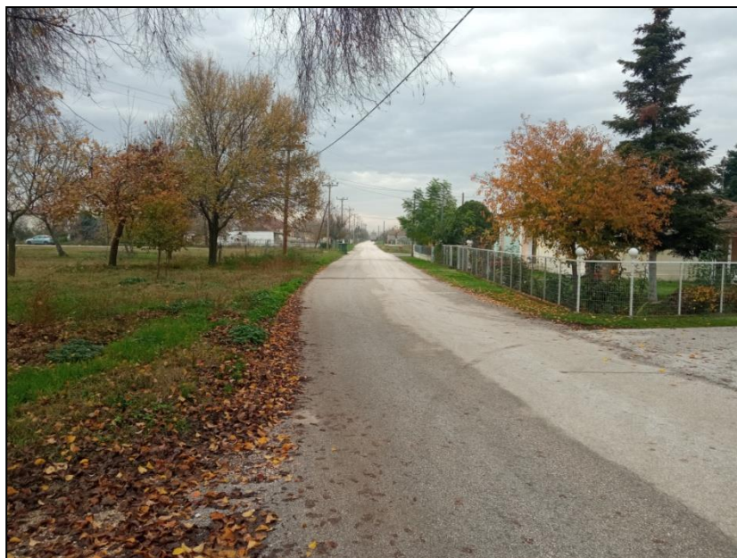
Φωτογραφία 21: Κεντρικός δρόμος οικισμού Αγίας Τριάδας / Απουσία πεζοδρομίων

πλατείας, όπου έχουν διαμορφωθεί πεζοδρόμια, χωρίς όμως τις απαραίτητες υποδομές για τις μετακινήσεις των ΑμεΑ.