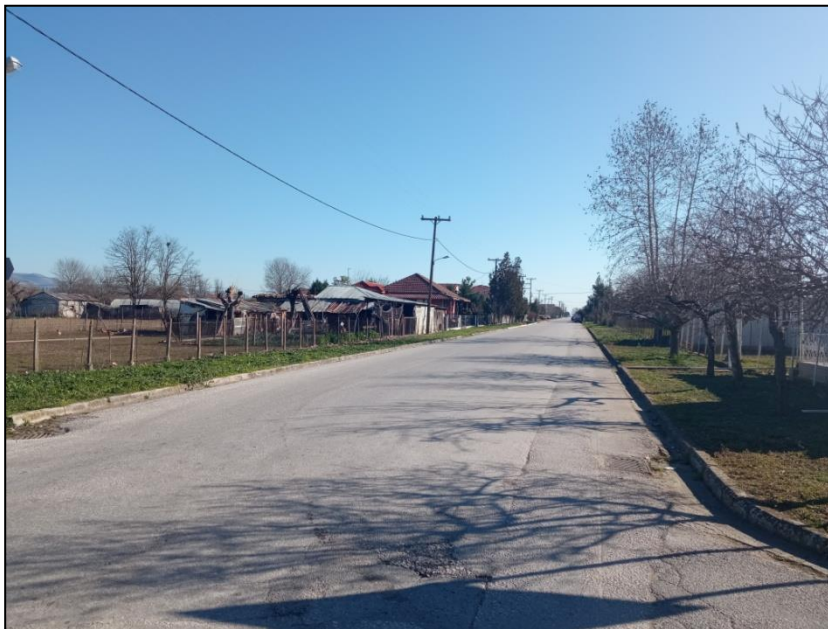
Φωτογραφία 3: Ενδεικτική εικόνα υφιστάμενων αδιαμόρφωτων πεζοδρομίων

Πέραν των παραπάνω παρεμβάσεων, σε όλο τον υπόλοιπο αστικό ιστό τα πεζοδρόμια είναι είτε με απλή τσιμεντόστρωση, είτε παρατηρείται μόνο το κράσπεδο - ρείθρο χωρίς διαμόρφωση, είτε απουσιάζουν πλήρως.