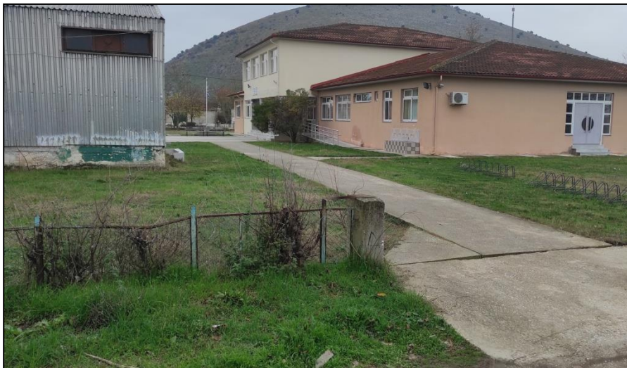
Φωτογραφία 8: Σχολεία & υφιστάμενη ράμπα πρόσβασης

Δυτικά της πλατείας καταγράφονται τα σχολεία (δημοτικό και νηπιαγωγείο) του οικισμού, ένα γήπεδο ποδοσφαίρου και ένας χώρος πρασίνου. Για την πρόσβαση των ΑμεΑ στα σχολεία έχει κατασκευαστεί πρόσφατα ράμπα πρόσβασης ΑμεΑ. Τέλος, ο οικισμός με εξαίρεση ένα πολύ μικρό τμήμα πλησίον της πλατείας, χαρακτηρίζεται από απουσία πεζοδρομίων.