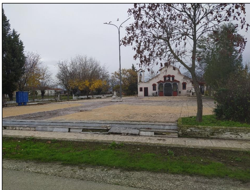
Φωτογραφία 49: Πλατεία Αμπελώνα

Ο Αμπελώνας αποτελεί έναν μικρό συνοικισμό του Φύλλου, με τον οποίο έχει σχέσεις έντονης εξάρτησης στις βασικές του λειτουργίες. Στον οικισμό κυριαρχεί η κατοικία, ενώ οι κοινόχρηστοι και κοινωφελείς χώροι περιορίζονται στην πλατεία του οικισμού και στον Ι.Ν. Αγίου Αθανασίου. Η πλατεία είναι μια διαμορφωμένη πλακόστρωτη επιφάνεια, η οποία διαφοροποιείται (είναι υψηλότερα) από το επίπεδο του δρόμου μέσω δυο σκαλοπατιών. Επιπλέον, δεν υπάρχουν οι απαραίτητες υποδομές πρόσβασης για τα ΑμεΑ σε αυτή. Περιμετρικά της πλατείας υπάρχει πεζοδρόμιο πλάτους 1,0μ. το οποίο δεν έχει κατασκευαστεί ολοκληρωμένο μέχρι το υπάρχον οδόστρωμα.