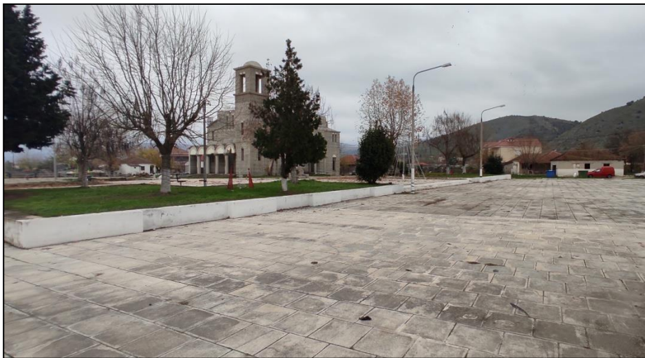
Φωτογραφία 6: Πλατεία Βλοχού

Ο Βλοχός αναπτύσσεται σε πεδινή περιοχή κατά μήκος του Ενιπέα ποταμού και δυτικά αυτού. Χαρακτηριστικό είναι το γεγονός ότι ένα μικρό τμήμα του, ο λεγόμενος "Πέρα Βλοχός", έχει αναπτυχθεί ανατολικά του ποταμού. Οι βασικές κοινόχρηστες και κοινωφελείς χρήσεις του οικισμού συναντώνται στο κέντρο του. Πιο συγκεκριμένα, καταγράφεται μια πλατεία, η οποία είναι διαμορφωμένη σε δυο επίπεδα. Στο επάνω επίπεδο βρίσκεται η παιδική χαρά και ο υπό ανέγερση Ιερός Ναός Αγίου Αθανασίου. Σημειώνεται ότι στην παιδική χαρά έχουν τοποθετηθεί σύγχρονα όργανα, αλλά δεν έχει ολοκληρωθεί η διαμόρφωση των δαπέδων ασφαλείας και η πρόσβαση σε αυτή. Στο κάτω επίπεδο της πλατείας συναντάται το κοινοτικό γραφείο με το αγροτικό ιατρείο (συστεγάζονται). Τόσο το κτίριο του κοινοτικού γραφείου, όσο και η πλατεία συνολικά δεν διαθέτουν υποδομές πρόσβασης για τα ΑμεΑ.