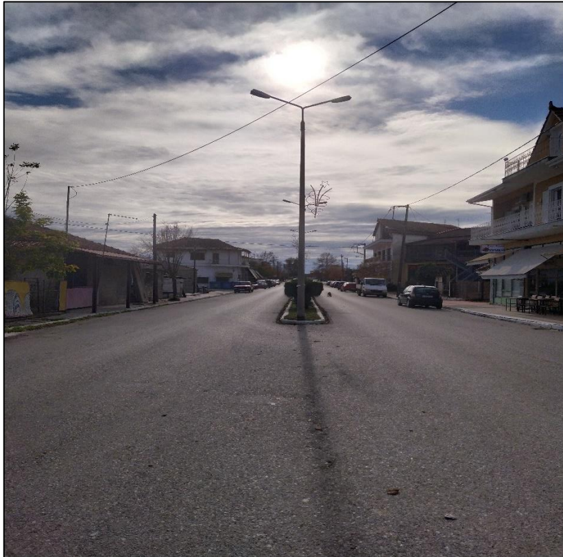
Φωτογραφία 41: Κεντρικός δρόμος οικισμού με νησίδα πρασίνου

Για τη διευκόλυνση των μετακινήσεων πεζών και αμαξιδίων στον οικισμό της Ιτέας οι προτεινόμενες παρεμβάσεις περιλαμβάνουν: