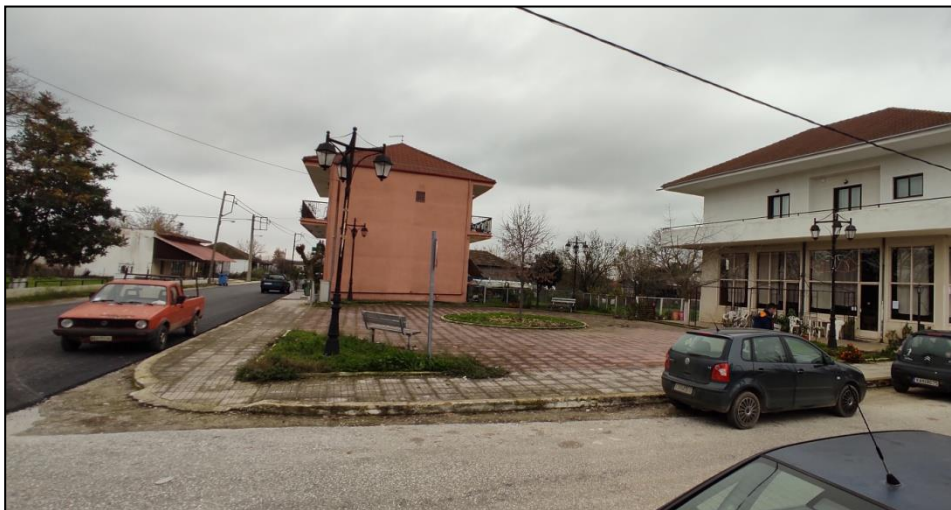
Φωτογραφία 14: Μικρό πλάτωμα

Δυτικά της πλατείας καταγράφεται μια παιδική χαρά και το κτίριο του κοινοτικού γραφείου, ενώ νότια της πλατείας συναντάται μικρό διαμορφωμένο πλάτωμα και ο Ι.Ν. Αγίου Γεωργίου. Ο οικισμός χαρακτηρίζεται από απουσία πεζοδρομίων με εξαίρεση ορισμένα μεμονωμένα μικρά τμήματα που κατασκευάστηκαν πλησίον της πλατείας. Τέλος, δυτικά του οικισμού χωροθετείται το γήπεδο ποδοσφαίρου.