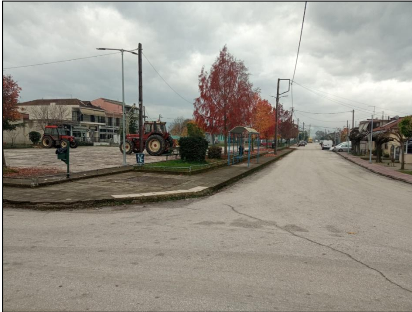
Φωτογραφία 22: Πλατεία Αγίας Τριάδας & στάση ΜΜΜ

Για τον οικισμό της Αγίας Τριάδας οι προτεινόμενες παρεμβάσεις αφορούν την κατασκευή πεζοδρομίων από την είσοδο οικισμού ανατολικά έως την πλατεία, την κατασκευή πεζοδρομίου μεταξύ πλατείας και παιδικής χαράς, τη συνέχιση του πεζοδρομίου μέχρι το κοινοτικό γραφείο, καθώς και την κατασκευή ραμπών πρόσβασης ΑμεΑ σε όλα τα υφιστάμενα πεζοδρόμια. Ειδικότερα για την πλατεία, προτείνεται η κατασκευή 2 ραμπών πρόσβασης ΑμεΑ σε αυτή (βόρεια και δυτικά). Επιπλέον, προτείνεται η κατασκευή μιας ράμπας ΑμεΑ στον Ι.Ν. Ταξιαρχών, μιας στον Ι.Ν. Νεομάρτυρα και Οσιομάρτυρα Δαμιανού, η ανακατασκευή της ράμπας ΑμεΑ στο προαύλιο του Ι.Ν. Αγίας Τριάδας, η κατασκευή μιας ράμπας ΑμεΑ για το κοινοτικό γραφείο και μιας για το νηπιαγωγείο, καθώς και η δημιουργία μιας θέσης στάθμευσης ΑμεΑ δυτικά της πλατείας.