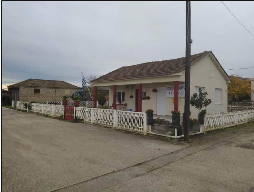
Φωτογραφία 43: Κοινοτικό γραφείο

Για τη διευκόλυνση των μετακινήσεων πεζών και αμαξιδίων στη Λεύκη προτείνεται αρχικά η κατασκευή νέων πεζοδρομίων στα οικοδομικά τετράγωνα όπου χωροθετείται η εκκλησία και το κοινοτικό γραφείο. Επιπλέον, προτείνεται η κατασκευή πεζοδρομίου περιμετρικά της πλατείας με τη διερεύνηση το νέο πεζοδρόμιο να γίνει κατόπιν συνολικής μελέτης ανάπλασης της πλατείας, ώστε να καταργηθούν τα περιμετρικά κάγκελα, να αποδοθεί ο χώρος των φυτεύσεων σε πεζοδρόμιο, να απομακρυνθεί η βρύση που εντοπίζεται στο νοτιο-ανατολικό τμήμα της επί του δρόμου, και να ενισχυθούν οι φυτεύσεις και ο αστικός εξοπλισμός στον υπόλοιπο κοινόχρηστο χώρο. Οι παρεμβάσεις ολοκληρώνονται με τον καθαρισμό, τη διαμόρφωση με πλακόστρωση και την κατασκευή ραμπών πρόσβασης ΑμεΑ σε όλα τα πεζοδρόμια του κεντρικού δρόμου, την κατασκευή μιας ράμπας ΑμεΑ για την πρόσβαση στο προαύλιο του Ι.Ν., μιας για το κτίριο του Ι.Ν. και μιας για την πρόσβαση στο κτίριο του κοινοτικού γραφείου, τη δημιουργία δυο διαβάσεων πεζών για την ενίσχυση της ασφάλειας των μετακινήσεων, καθώς και τη δημιουργία μιας θέσης στάθμευσης οχημάτων ΑμεΑ ανατολικά της πλατείας.