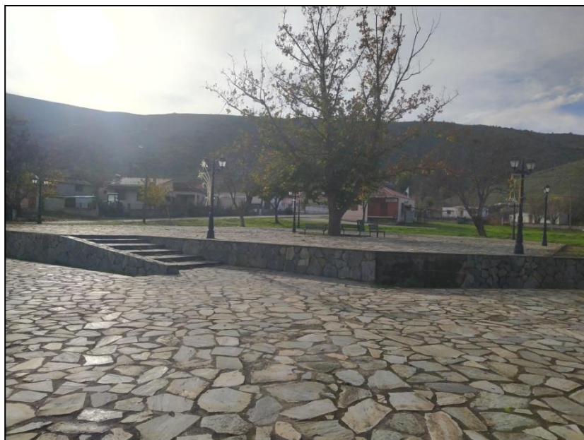
Φωτογραφία 4: Πλατεία Αγίου Δημητρίου

αθλητικός χώρος και χώρος πρασίνου, ενώ στο νοτιο-δυτικό τμήμα χωροθετείται ο Ι.Ν. Αγίου Δημητρίου.