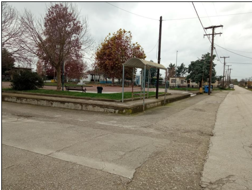
Φωτογραφία 26: Πλατεία Κόρδας / Κατασκευή περιμετρικού πεζοδρομίου

Πιο αναλυτικά, ο οικισμός χαρακτηρίζεται από πλήρη απουσία πεζοδρομίων στο εσωτερικό του. Η πλατεία του οικισμού αποτελείται από ισόπεδη επιφάνεια, με αστικό εξοπλισμό και φυτεύσεις, χωρίς όμως να είναι προσβάσιμη στα ΑμεΑ. Παρατηρείται δε η απουσία περιμετρικού πεζοδρομίου, με αποτέλεσμα μέρος της υπάρχουσας στάσης ΜΜΜ (κιόσκι) να είναι τοποθετημένο επί της πλατείας και μέρος να βρίσκεται στο επίπεδο του δρόμου. Δυτικά της πλατείας εντοπίζεται παιδική χαρά η οποία κρίνεται ημιτελής, καθώς έχουν τοποθετηθεί σύγχρονα όργανα παιδικής χαράς αλλά δεν έχει διαμορφωθεί η πρόσβαση σε αυτή. Παράδοξο είναι το γεγονός ότι η πόρτα εισόδου στην παιδική χαρά έχει τοποθετηθεί νότια (όπου υπάρχει αδιαμόρφωτη κοινοτική έκταση) και όχι βόρεια όπου εφάπτεται του δρόμου. Τέλος, ο Ι.Ν. Αγίου Αθανασίου διαθέτει ράμπα πρόσβασης ΑμεΑ στο πεζοδρόμιο δυτικά, η οποία όμως δεν πληροί τις προδιαγραφές και απαιτείται να ανακατασκευαστεί.