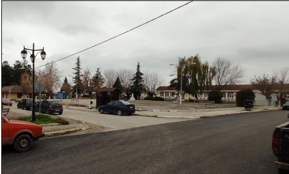
Φωτογραφία 13: Πλατεία Κοσκινά

Δυτικά της πλατείας καταγράφεται μια παιδική χαρά και το κτίριο του κοινοτικού γραφείου, ενώ νότια της πλατείας συναντάται μικρό διαμορφωμένο πλάτωμα και ο Ι.Ν. Αγίου Γεωργίου. Ο οικισμός χαρακτηρίζεται από απουσία πεζοδρομίων με εξαίρεση ορισμένα μεμονωμένα μικρά τμήματα που κατασκευάστηκαν πλησίον της πλατείας. Τέλος, δυτικά του οικισμού χωροθετείται το γήπεδο ποδοσφαίρου.