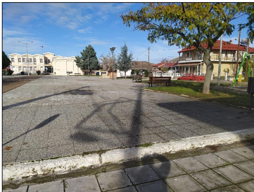
Φωτογραφία 38: Πλατεία Ιτέας

αυτοκινήτων και παιδική χαρά, ενώ νότια της πλατείας και στο επίπεδο του δρόμου εντοπίζεται ο Ι.Ν. Αγίου Αθανασίου.