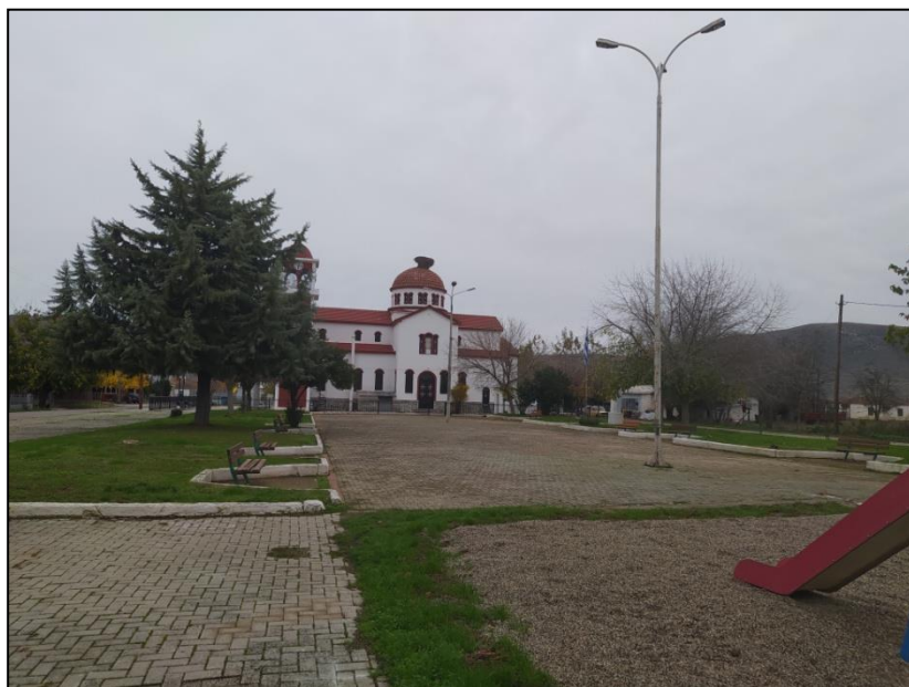
Φωτογραφία 44: Πλατεία Ορφανών & Ι.Ν. Αγίου Δημητρίου

Οι βασικές λειτουργίες του οικισμού εντοπίζονται στο κέντρο του. Εκεί καταγράφονται η πλατεία, ο Ι.Ν. Αγίου Δημητρίου, η παιδική χαρά και το κτίριο του κοινοτικού γραφείου όπου φιλοξενείται το αγροτικό ιατρείο. Στο δυτικό τμήμα του οικισμού εντοπίζεται γήπεδο ποδοσφαίρου, το οποίο εμφανίζει εικόνα εγκατάλειψης. Σημειώνεται ότι όλοι οι προαναφερόμενοι χώροι δεν είναι προσβάσιμοι στα ΑμεΑ.