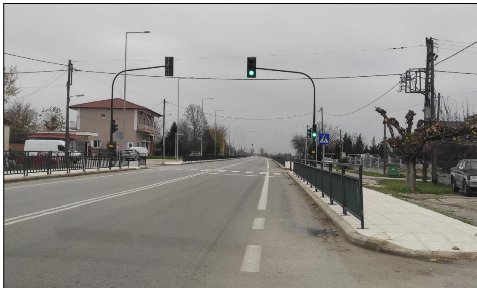
Φωτογραφία 16: Επαρχιακή οδός Γοργοβιτών - Παλαμά στην επαφή με τον οικισμό του Μάρκου

διαμορφωθεί πεζοδρόμια και έχουν τοποθετηθεί κιγκλιδώματα για λόγους ασφαλείας. Τα πεζοδρόμια όμως αυτά δεν είναι προσβάσιμα στα ΑμεΑ (απουσιάζουν ράμπες πρόσβασης και οδεύσεις τυφλών).