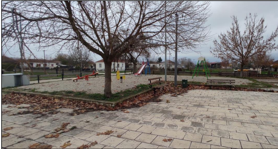
Φωτογραφία 7: Παιδική χαρά

Δυτικά της πλατείας καταγράφονται τα σχολεία (δημοτικό και νηπιαγωγείο) του οικισμού, ένα γήπεδο ποδοσφαίρου και ένας χώρος πρασίνου. Για την πρόσβαση των ΑμεΑ στα σχολεία έχει κατασκευαστεί πρόσφατα ράμπα πρόσβασης ΑμεΑ. Τέλος, ο οικισμός με εξαίρεση ένα πολύ μικρό τμήμα πλησίον της πλατείας, χαρακτηρίζεται από απουσία πεζοδρομίων.