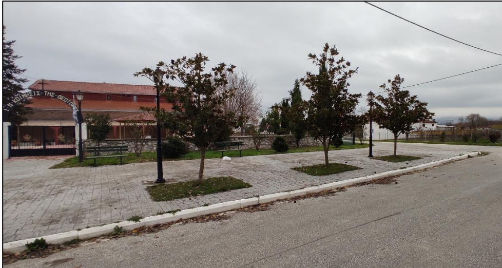
Φωτογραφία 18: Ι.Ν. Κοιμήσεως Θεοτόκου

Ως προς τις υποδομές για τις μετακινήσεις πεζών, αυτές είναι ελάχιστες. Πεζοδρόμια έχουν κατασκευαστεί στο νότιο και ανατολικό τμήμα της εκκλησίας καθώς και στο νότιο και ανατολικό τμήμα της πλατείας, χωρίς όμως να είναι προσβάσιμα στα ΑμεΑ.