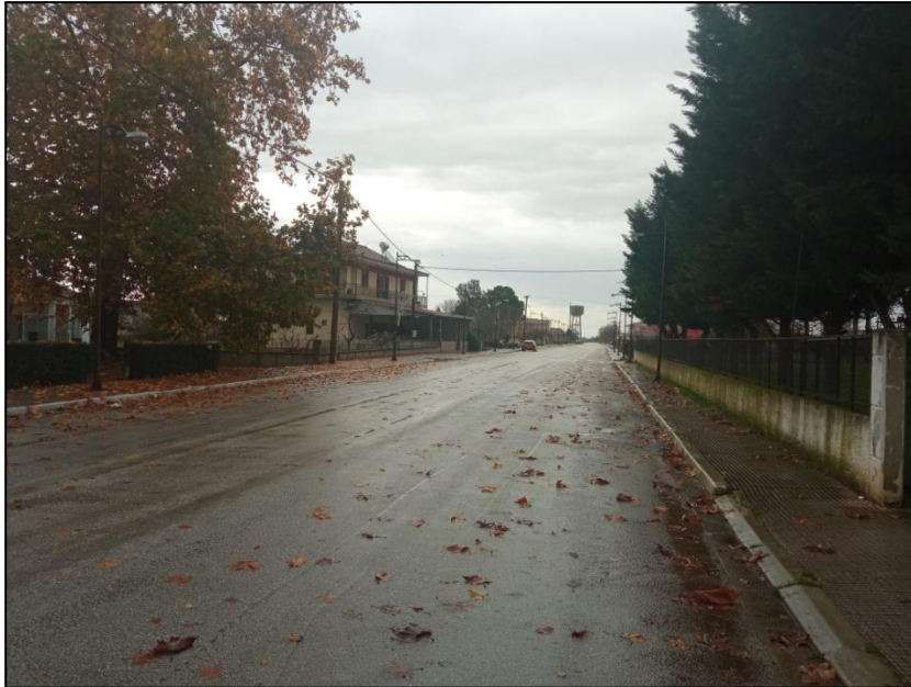
Φωτογραφία 33: Οδός Παπάγου & πεζοδρόμιο

Ως προς τις χρήσεις γης, στο νότιο τμήμα του οικισμού καταγράφονται το Γυμνάσιο και το Λύκειο Προαστίου (διαθέτουν ράμπας πρόσβασης ΑμεΑ), αθλητικές υποδομές, ένας χώρος πρασίνου, το αμαξοστάσιο του δήμου, μια στάση ΜΜΜ (κίόσκι) που χρήζει μετατόπισης καθώς αποτελεί εμπόδιο στην κίνηση των πεζών, ενώ κατά το παρελθόν στην περιοχή αυτή έχει κατασκευαστεί ένα μικρό τμήμα ποδηλατόδρομου.