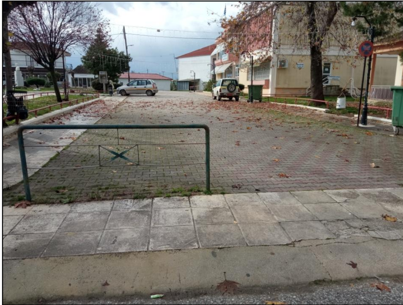
Φωτογραφία 34: Δρόμος πρόσβασης σε πλατεία & παλιό Δημαρχείο