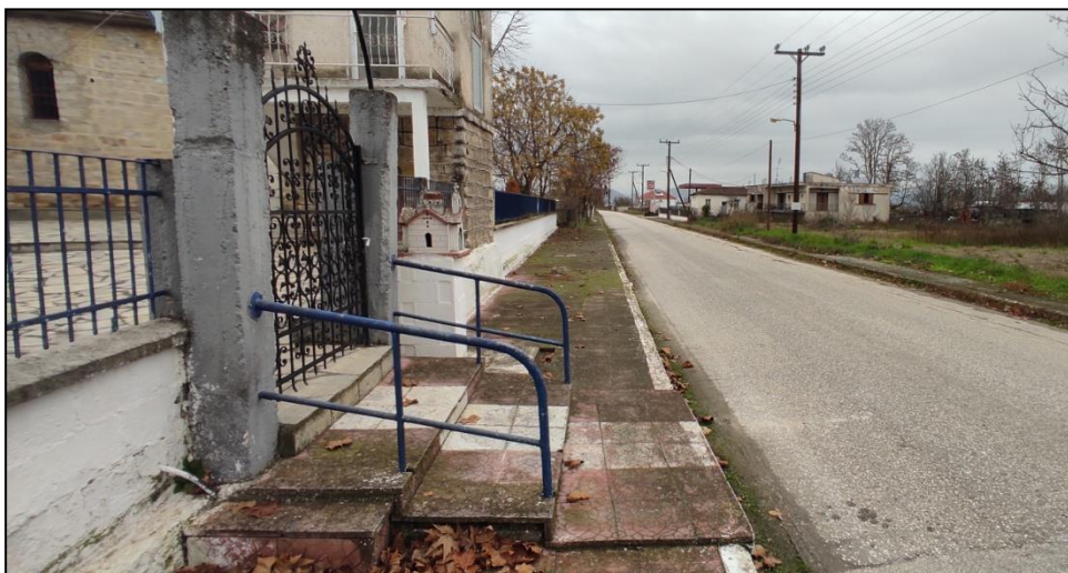
Φωτογραφία 12: Πεζοδρόμιο έμπροσθεν Ι.Ν. Αγίου Αθανασίου

Ως προς τις κοινόχρηστες και κοινωφελείς χρήσεις στον οικισμό καταγράφεται μια πλατεία επί της οποίας εντοπίζεται το κτίριο του κοινοτικού γραφείου. Η πρόσβαση στην πλατεία γίνεται μέσω κλίμακας 5 σκαλοπατιών, ενώ για την προσβασιμότητα των ΑμεΑ έχει διαμορφωθεί ράμπα πρόσβασης στο βόρειο τμήμα της, η κλίση της οποίας είναι απαγορευτική. Επιπρόσθετα, καταγράφονται ένας χώρος πρασίνου (νότια), το γραφείο του πολιτιστικού συλλόγου και η σχολή εικαστικών τεχνών (λειτουργεί 3 φορές την εβδομάδα), ο Ι.Ν. Αγίου Αθανασίου, μια παιδική χαρά και το κτίριο του τεχνικού λυκείου όπου λειτουργούν ορισμένα εργαστήρια. Επισημαίνεται εδώ ότι τα κτίρια των κοινωφελών χρήσεων δεν είναι προσβάσιμα στα ΑμεΑ, ενώ για την πρόσβαση στην εκκλησία έχουν διαμορφωθεί σκαλοπάτια με κάγκελα επί του υπάρχοντος πεζοδρομίου (ανατολικά), τα οποία αποτελούν εμπόδιο στην μετακίνηση πεζών και αμαξιδίων.