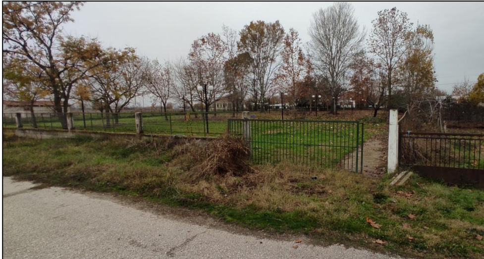
Φωτογραφία 10: Χώρος πρασίνου (νοτιο-δυτικά)

Για τους Γοργοβίτες οι προτεινόμενες παρεμβάσεις αφορούν στην επίτευξη της προσβασιμότητας των υφιστάμενων πεζοδρομίων με την κατασκευή ραμπών πρόσβασης ΑμεΑ και οδεύσεων τυφλών, στην κατασκευή νέων πεζοδρόμων σύνδεσης της πλατείας με το χώρο πρασίνου και το γήπεδο ποδοσφαίρου, στην κατασκευή ραμπών πρόσβασης ΑμεΑ στην πλατεία και στην παιδική χαρά, στην κατασκευή μιας ράμπας ΑμεΑ στο κτίριο του κοινοτικού γραφείου και στη δημιουργία μιας θέσης στάθμευσης ΑμεΑ στο ανατολικό τμήμα της πλατείας. Τέλος, απαιτείται η μετατόπιση ή αφαίρεση του περιπτέρου που βρίσκεται στην πλατεία και το οποίο δεν λειτουργεί.