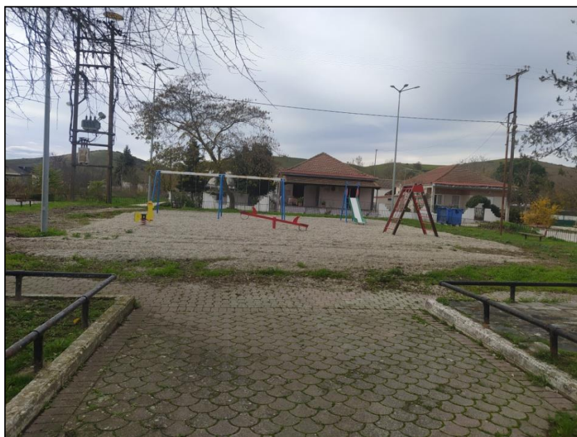
Φωτογραφία 48: Παιδική χαρά