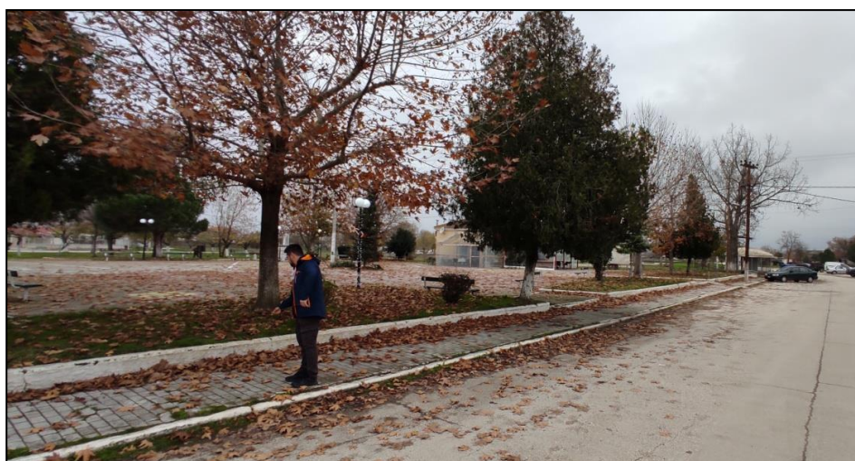
Φωτογραφία 17: Πλατεία Μάρκου

Ως προς τις κοινόχρηστες και κοινωφελείς χρήσεις, καταγράφονται ο Ι.Ν. Αγίου Αθανασίου και ένας χώρος πρασίνου στο βόρειο τμήμα του οικισμού, ενώ στο κέντρο εντοπίζονται η πλατεία, μια παιδική χαρά, ένας χώρος στάθμευσης οχημάτων, το κοινοτικό γραφείο μαζί με το αγροτικό ιατρείο, το γραφείο του πολιτιστικού συλλόγου, μια στάση ΜΜΜ (κιόσκι), το νηπιαγωγείο και αθλητικοί χώροι (γήπεδα ποδοσφαίρου, μπάσκετ και βόλεϊ). Σημειώνεται εδώ ότι τόσο η πλατεία όσο και τα κτίρια των κοινωφελών χρήσεων (με εξαίρεση το νηπιαγωγείο) δεν διαθέτουν τις αναγκαίες υποδομές πρόσβασης για τα ΑμεΑ.