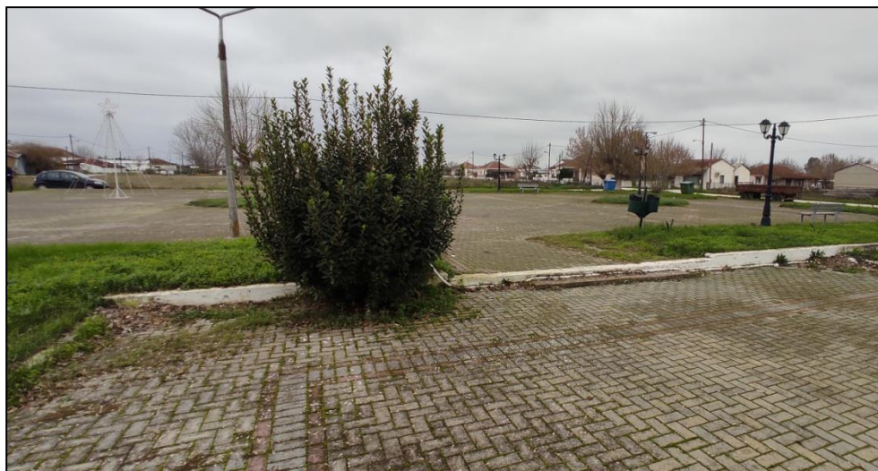
Φωτογραφία 15: Πλατεία Ψαθοχωρίου

Το Ψαθοχώρι αποτελεί πολύ μικρό οικισμό του Δήμου Παλαμά με ορθογωνικής διάταξης οικοδομικά τετράγωνα. Εξαιτίας του μικρού μεγέθους του οικισμού, οι χρήσεις γης είναι αρκετά περιορισμένες. Κεντρικά στον οικισμό καταγράφονται μια πλατεία, ο Ι.Ν. Αγίου Σεραφείμ και μια παιδική χαρά (στο προαύλιο του παλιού δημοτικού σχολείου). Δυτικά του οικισμού εντοπίζεται ένα γήπεδο ποδοσφαίρου, ενώ από τον αστικό απουσιάζουν πλήρως τα πεζοδρόμια.