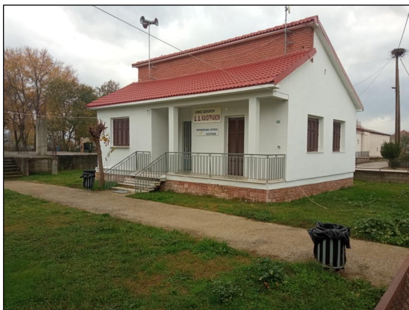
Φωτογραφία 24: Κοινοτικό γραφείο / αγροτικό ιατρείο

Επιπρόσθετα στις παραπάνω χρήσεις καταγράφονται βορειο-ανατολικά της πλατείας ο Ι.Ν. Ζωοδόχου Πηγής μαζί με την παλιά εκκλησία, η παιδική χαρά και μια στάση ΜΜΜ (κιόσκι). Αξιοσημείωτο στην παιδική χαρά είναι το γεγονός ότι ενώ έχουν τοποθετηθεί σύγχρονα όργανα δεν έχει αποκατασταθεί η πρόσβαση, με αποτέλεσμα τον αποκλεισμό των ΑμεΑ από αυτή. Η μεγάλη υψομετρική διαφορά μεταξύ του επιπέδου της παιδικής χαράς και του οδοστρώματος, σε συνδυασμό με το υπάρχον στενό πεζοδρόμιο στο οποίο καταγράφονται