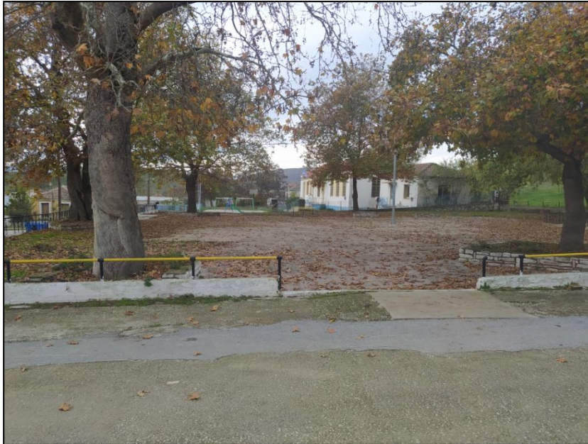
Φωτογραφία 46: Πλατεία Πέτρινου

Για το Πέτρινο, οι προτεινόμενες παρεμβάσεις επικεντρώνονται αρχικά στην ολοκλήρωση της διαμόρφωσης στα υφιστάμενα πεζοδρόμια της ανατολικής πλευράς του κεντρικού δρόμου με την ταυτόχρονη κατασκευή ραμπών πρόσβασης και οδεύσεων τυφλών. Επιπλέον, προτείνεται η κατασκευή πεζοδρομίου στο νότιο και ανατολικό τμήμα της πλατείας και η κατασκευή ράμπας πρόσβασης ΑμεΑ ανατολικά για τη διευκόλυνση της πρόσβασης σε αυτή. Τέλος, προτείνεται η δημιουργία μιας θέσης στάθμευσης ΑμεΑ ανατολικά της πλατείας, η τοποθέτηση ενός ηλεκτρικού αναβατορίου στον Ι.Ν. Αγίου Δημητρίου και η μετατόπιση της υπάρχουσας βρύσης στο πεζοδρόμιο πλησίον του χώρου πρασίνου και η τοποθέτησή της στο εσωτερικό αυτού (αποτελεί εμπόδιο στο πεζοδρόμιο).