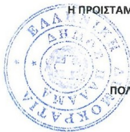
ΔΗΜΟΥΛΑ ΑΝΑΣΤΑΣΙΑ ΠΟΛΙΤΙΚΟΣ ΜΗΧΑΝΙΚΟΣ