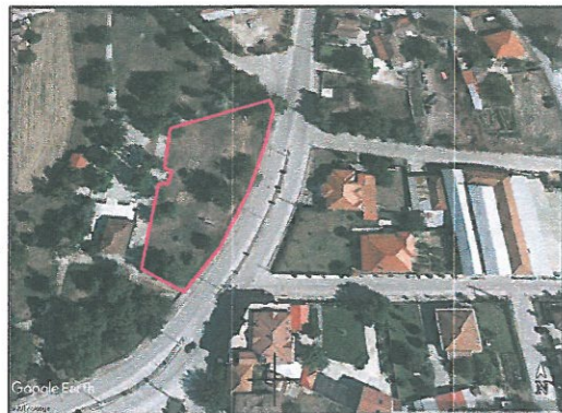
ΟΡΙΑ ΠΕΡΙΟΧΗΣ ΠΑΡΕΜΒΑΣΗΣ