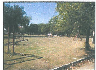
ΦΩΤΟΓΡΑΦΙΑ 3 (ΥΦΙΣΤΑΜΕΝΗ ΚΑΤΑΣΤΑΣΗ)