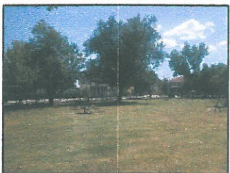
ΦΩΤΟΓΡΑΦΙΑ 3 (ΥΦΙΣΤΑΜΕΝΗ ΚΑΤΑΣΤΑΣΗ)